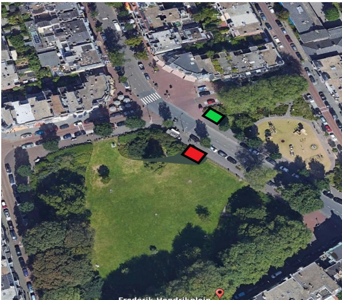
Afbeelding 4: rood: nieuwe locatie volgens plan; groen: eerder voorstel nieuwe locatie

Uit de plantekeningen en de afbeeldingen 2 en 4 blijkt dat de nieuwe kiosk mede gezien de grotere afmetingen een zeer dominante plaats zal gaan innemen op zowel het plein als ook het park. Dit vereist een aantal forse ingrepen in de bestaande situatie: aanpassing van het monumentale hekwerk, banken die na ruim een jaar weer worden verwijderd en de beplanting van het park, die zal moeten worden aangepast. Deze ingreep betekent een forse verstoring van de bestaande symmetrie rond de ingang van het park, die ook door de uitbreiding van het plantvak met enkele struiken niet gecamoufleerd of ongedaan gemaakt kan worden.