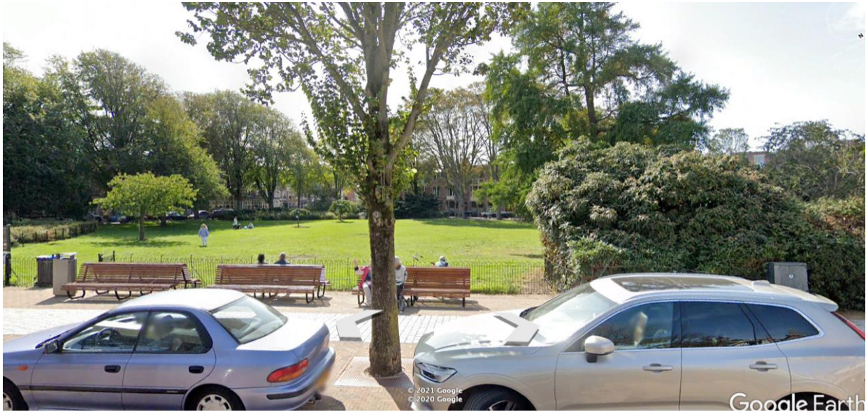
Afb. 1: Huidige situatie van de entree van het park en zicht op het gazon (zonder kiosk)

De nieuwe kiosk is geprojecteerd aan de rand van het gazon tegenover de boom, op de plaats waar nu nog banken staan. Het bestaande plantvak op de hoek wordt uitgebreid zodat dit de kiosk zal omsluiten. De nieuwe kiosk is met 36 m 2 bruto vloeroppervlak duidelijk groter qua volume dan de huidige kiosk en overschrijdt daarmee de maximaal toegestane maat van 25 m 2 (zie kanttekeningen bij ruimtelijke onderbouwing, verderop in de tekst).