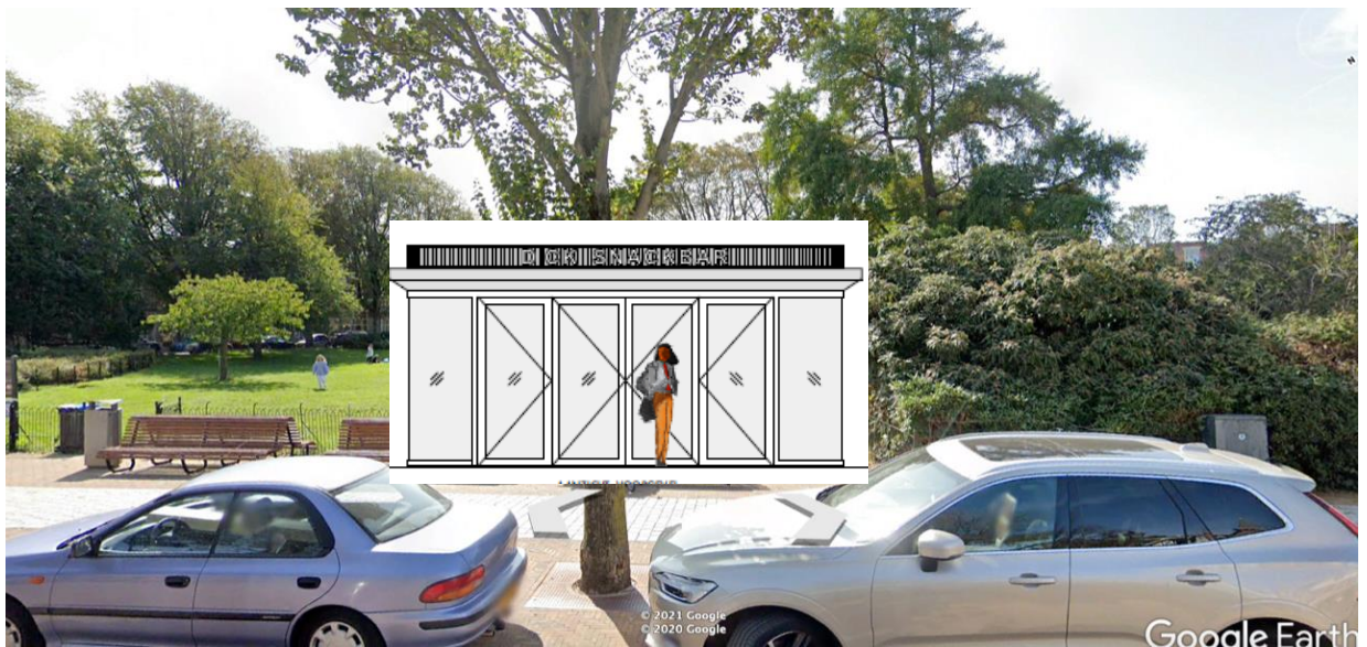
Afb. 2: Huidige situatie van de entree van het park en zicht op het gazon (met kiosk)