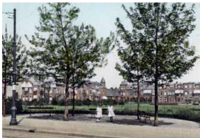
Frederik Hendrikplein

Door een tekst voor de capsule aan te leveren, kunnen bewoners aangeven wat de komende 50 jaar niet door 'de tand des tijds' mag worden aangetast in het Statenkwartier.