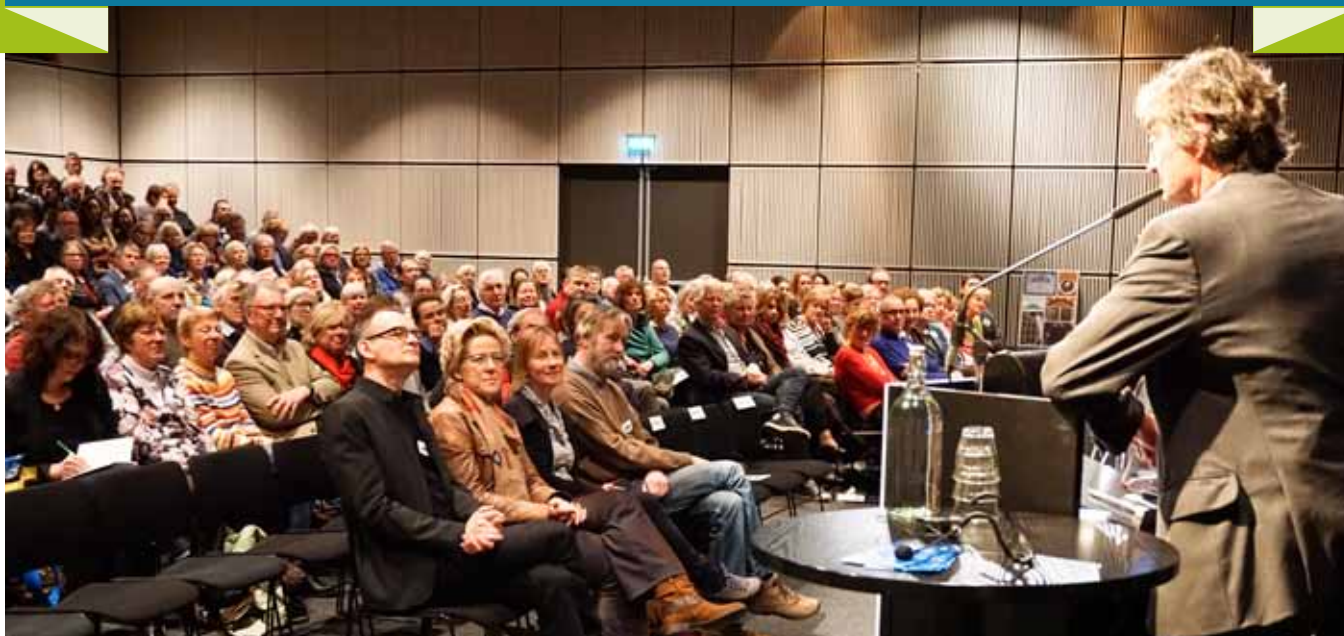
Presentatie van het wandelboek 'Struinen door het Statenkwartier'