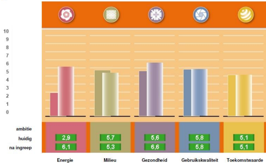
Resultaten GPR gebouw 4.1

Is een rekenmodel waarbij de huidige en gewenste situatie wordt ingevuld.